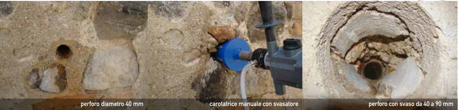
perforo diametro 40 mm