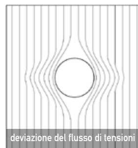
deviazione del flusso di tensioni

Lo svaso alle estremità, realizzato con carotaggio a diametro variabile, migliora il meccanismo di trasmissione della compressione trasversale alla muratura, grazie alla nascita di componenti orizzontali dell'azione di compressione sul carotaggio svasato che vanno a sommarsi alle azioni tangenziali distribuite sulla superficie del carotaggio.